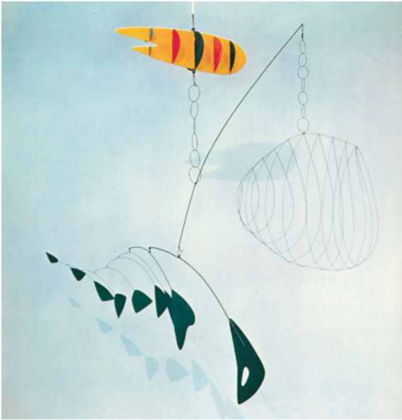
図 6 ⑦「海老を捕まえる罟と魚の尾」

それらの作品が初めて作られたのは 1939 年代のことで、アメリカ人 ⑦ によってである。このモビルと彫刻との関係は、ちょうど映画と写真の関係に相当する。⑦ の「海老を捕まえる罟と魚の尾」(図 6) は、金属板を針金でつるした巨大な作品である。この形は紛れもなく ⑧ のあの奇妙な詩的生物を思い出させる。大がかりな作品ではあるが、非常に精巧にバランスをとっているのも、ごくわずかの空気の動きにも、優美にふわりふわり浮動し一風にそよぐ木の葉や、波間に浮遊する海洋動物のように一予感できない、常に変化する動きで、自然と共に次から次へと絶えず形を変える。それは人