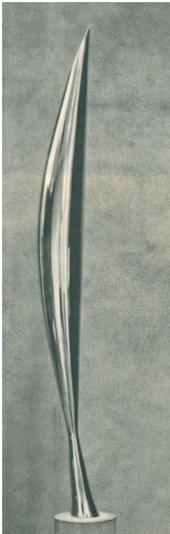
図 3 ①「空間の鳥」

この作品に用いられた金属には鏡のような光沢があるため、表面にはまわりの光景が映しだされる。この物体のどこにもいささかの個性も実在性も感じられず、我々を包む空間と同じ自由空間を内に持った、形を与えられた輝く空間の如くである。