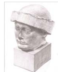
平成28年度 合格者答案 《グデア》