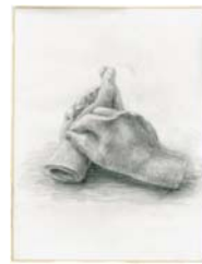
平成25年度 合格者答案 手首2個